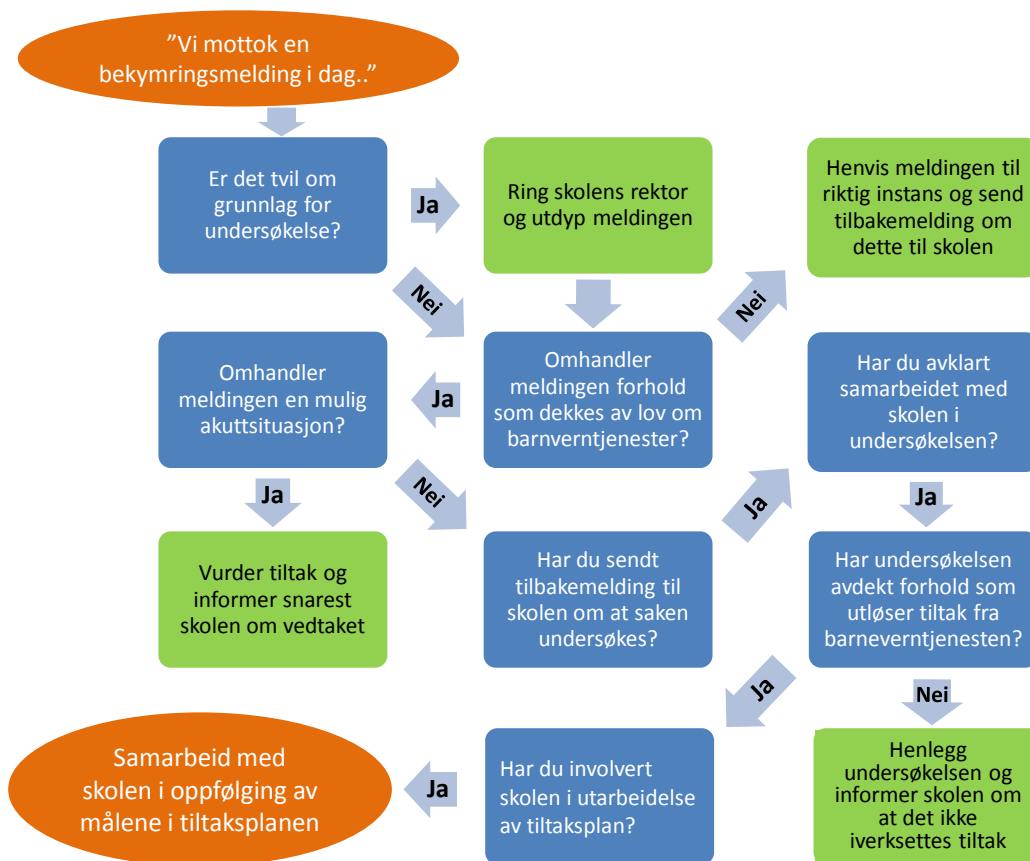
Figur 2: Barneverntjenestens framgangsmåte i forbindelse med bekymringsmeldinger

Nedenfor beskrives barneverntjenestens framgangsmåte når de mottar en bekymringsmelding fra skolen. Figur 2 gir en forenklet framstilling av kontrollspørsmålene ansatte i barneverntjenesten skal stille seg underveis i en bekymringssak, og fram mot et eventuelt tiltak. Barneverntjenestens innhenting av samtykke fra foresatte, muligheter for bruk av tvang, samt innholdet i undersøkelser og tiltak, er ikke omtalt i figuren, men omtales i de påfølgende avsnitt.