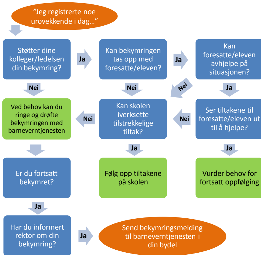
Figur 1: Skolens framgangsmåte ved bekymring for en elevs omsorgssituasjon

Nedenfor beskrives skolens framgangsmåte når en ansatt blir bekymret for en elev. Figur 1 gir en forenklet framstilling av kontrollspørsmålene ansatte i skolen bør stille seg underveis i en bekymrings sak, fram mot en eventuell bekymringsmelding til barneverntjenesten.